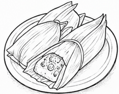
Tamales (Tamales) Maisteig in Maisblätter gefüllt und gedämpft