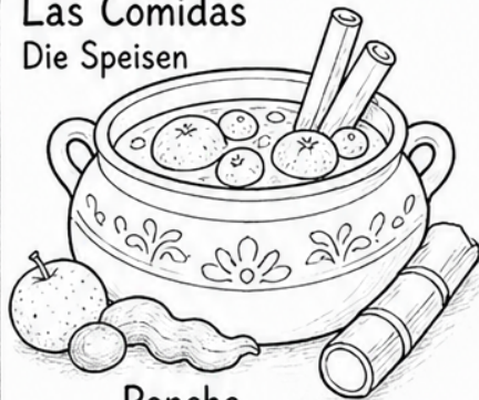
Ponche (Ponche) Heißer Fruchtpunsch